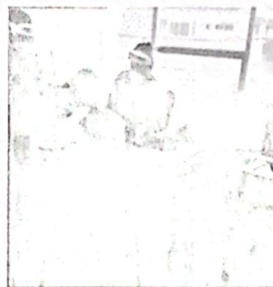
Toma de Pruebas

Se hace la verificación de la lista de chequeo en la cual se incluyeron los 9 numerales que debe contener el protocolo de bioseguridad, se presenta el avance del documento y los formatos que se han creado como requisito del protocolo