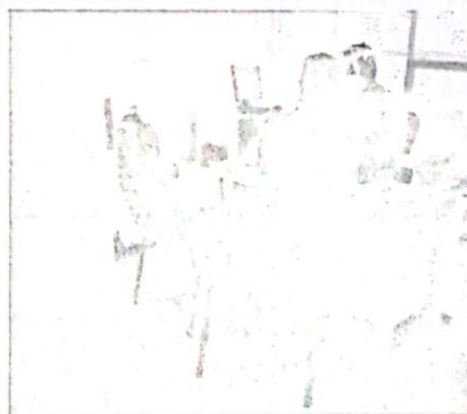
Toma de Pruebas