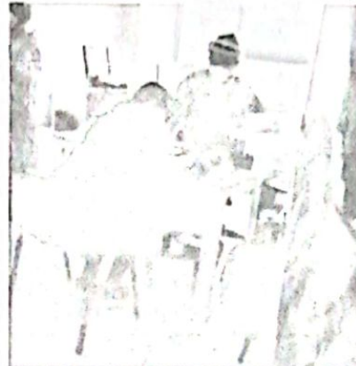
Toma de Pruebas