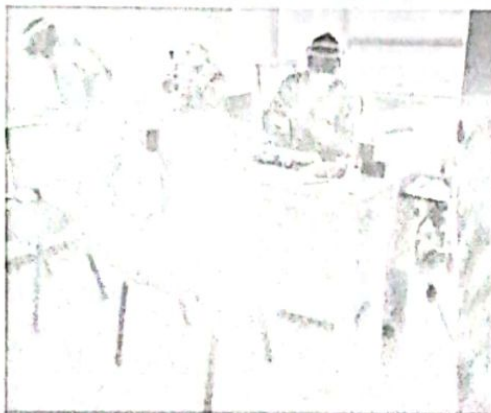
Toma de Pruebas